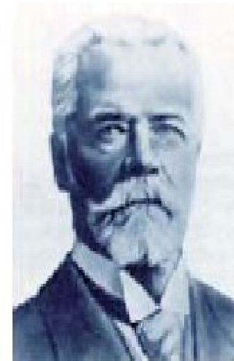
Henry o Henri FAYOL (1841-1925)