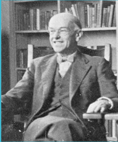
George Elton MAYO (1880-1949)