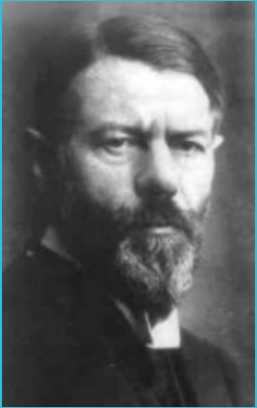
Max WEBER (1864 – 1920)