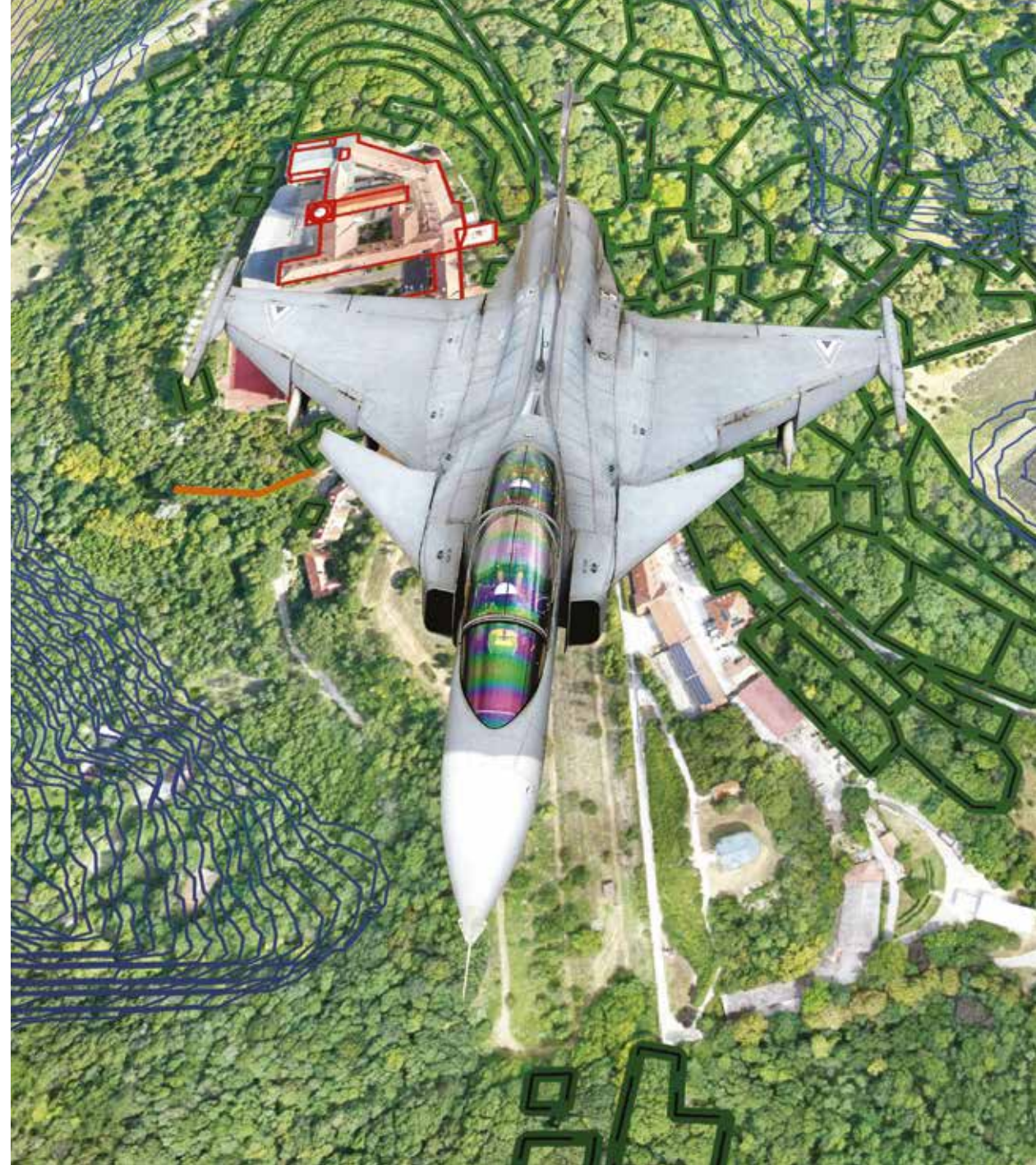
TÉRKÉPEINK A GRIPENEK SZOLGÁLATÁBAN.