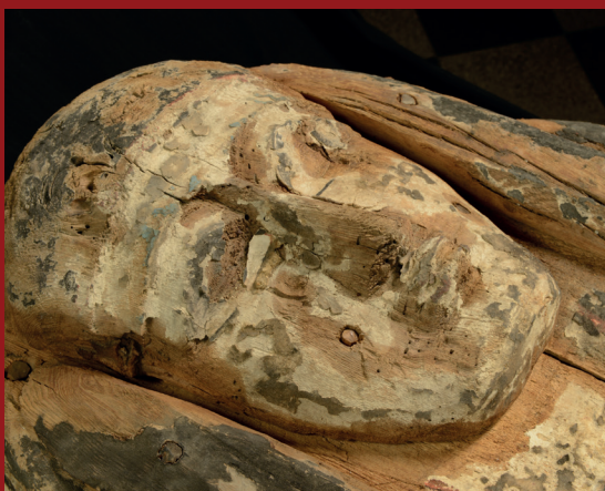
Műkincsek, műemlékek 3D modellje