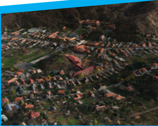
3D városmodell várostervezéshez