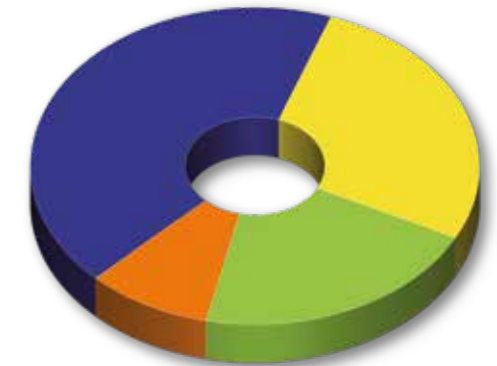
Nemzetközi piacok árbevétele régióként (2020)

A Társaság árbevételének több mint 92%-a exporttevékenységének eredménye: 2020-ban 1495,5 millió euró. Legnagyobb nemzetközi piacaink: USA, Oroszország, Lengyelország, Németország, Ukrajna és Románia.